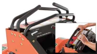
Quad Control Handle systeem