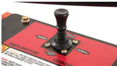
Joy-stick deflector bediening