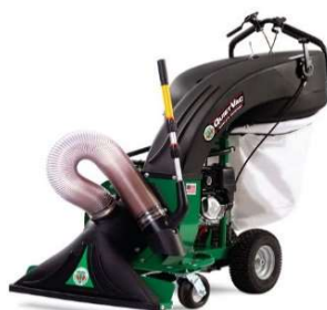
QV-series, met optionele zuigdarmkit