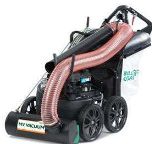
MV-series, met optionele zuigdarmkit