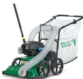
KV-series, met optionele zuigdarmkit