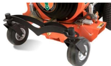
Getorste vooras voor comfortabel rijden over obstakels