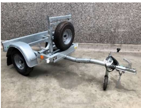
Trailer op maat